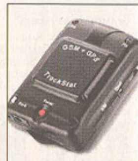
Utilizza il sistema Gps

I CLASSICI SPOSTAMENTI IL RILEVATORE SATELLITARE