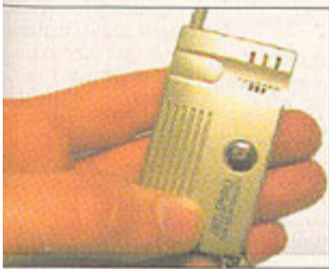
per le chiavi della macchina

ava un piccola torcia are il buco della serratura o molti preferiscono le stanze in cui entra- ortachiaivi: 39 euro.