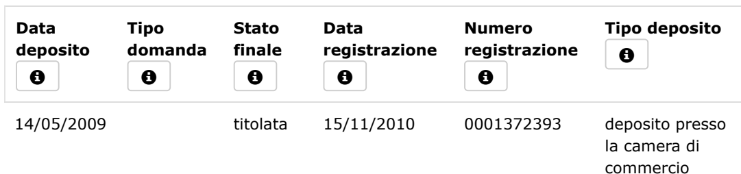
IMMAGINE NON DISPONIBILE

Informazioni identificative della domanda di marchio d'impresa numero 302009901732168 presentata il 14/05/2009 ( RM2009C002887 )